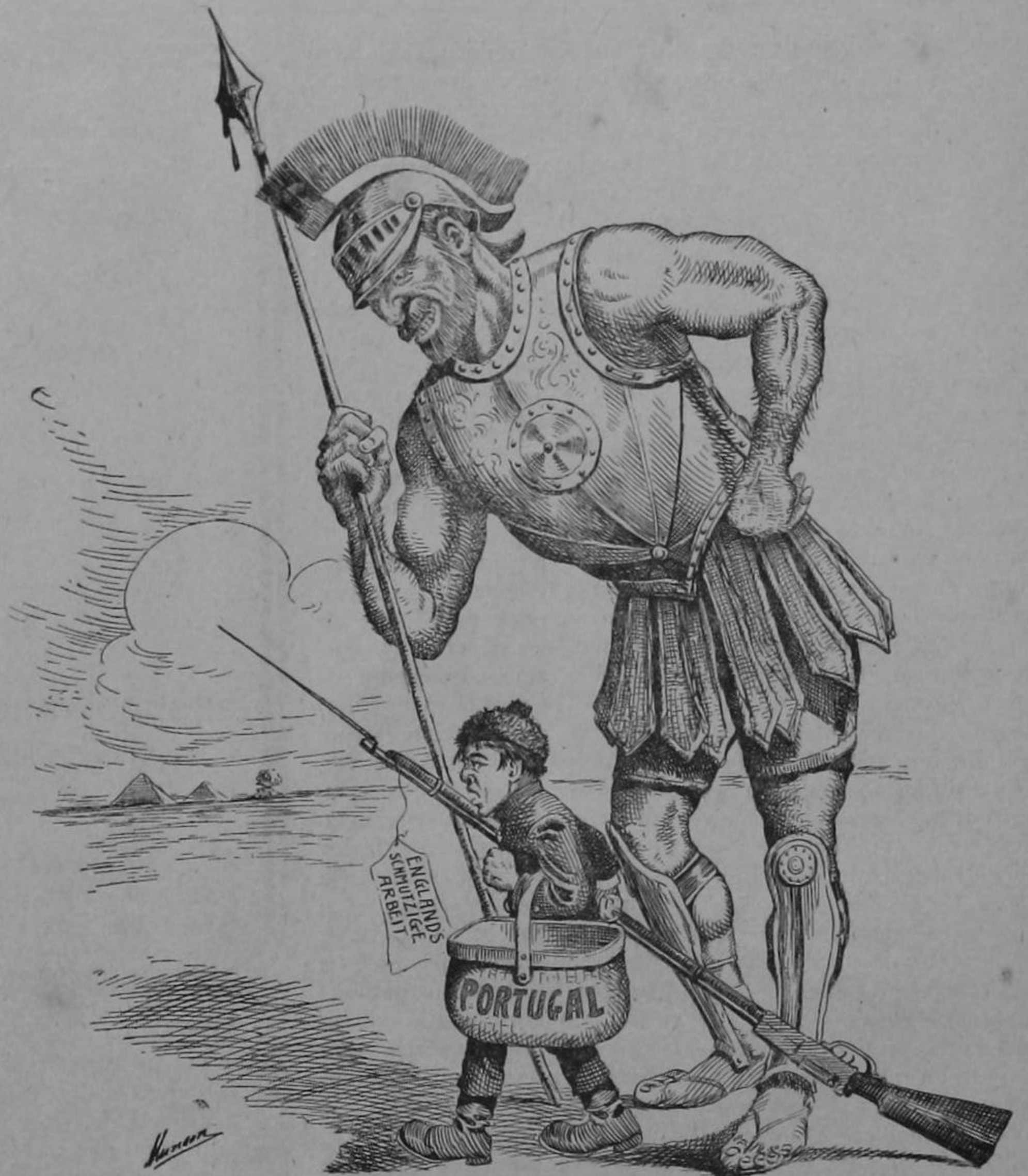
MARTE.—Dime chiquillo, a donde vas con ese rifle miniatura y ese aspecto tan fiero? PORTUGAL.—Yo no voy, es que me mandan a Egipto a conseguir unas hojas de laurel que para su adorno necesita Inglaterra, mi madrastra.